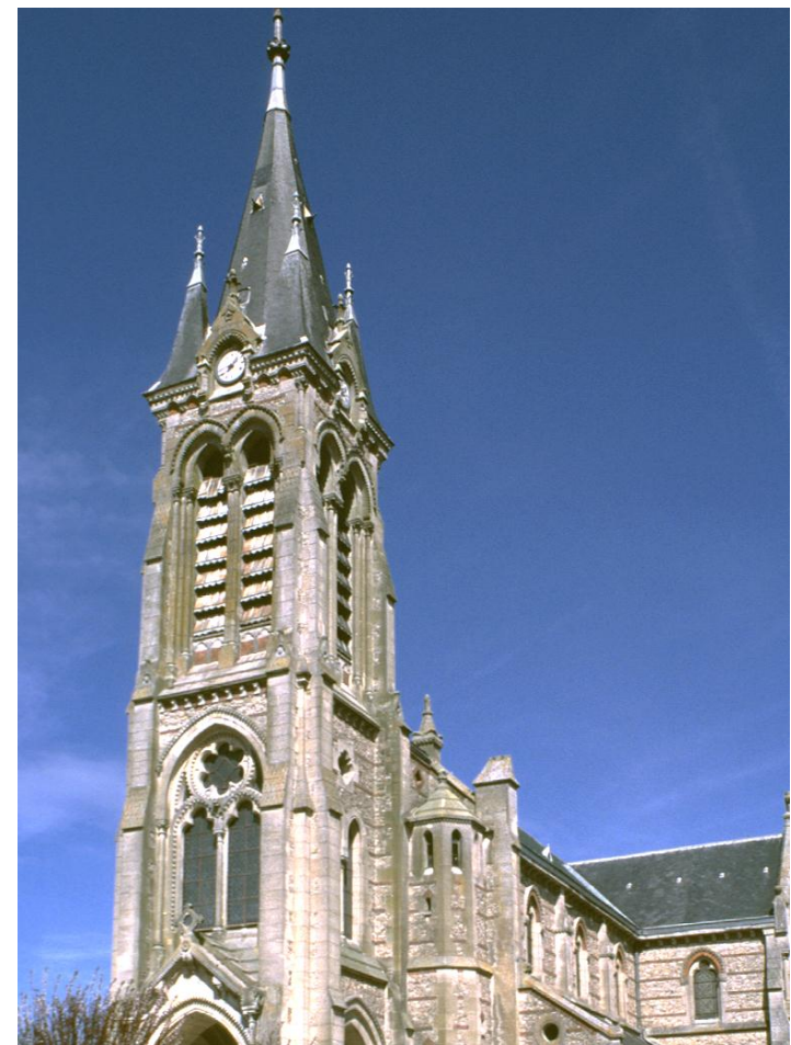
Réalisé par l'équipe paroissiale «Art sacré/Patrimoine» octobre 2012