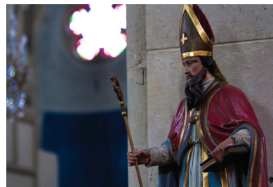
Realisé par l'équipe paroissiale "Patrimoine / Artisanat" - 2013